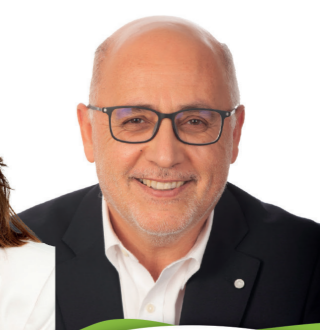
ANTONIO MORALES Candidato al Cabildo de Canarias