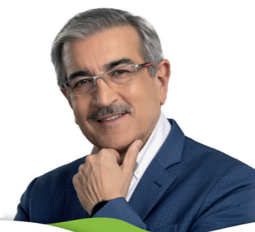
ROMÁN RODRÍGUEZ A la presidencia del Gobierno de Canarias