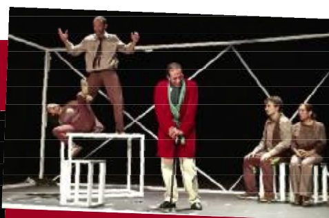
4 JULIO / Teatro con 'La República'

7 Y 10 JULIO / Deporte en la Plaza de Sintés