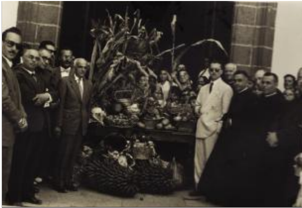
Actos de la Fiesta del Agua en la década de 1950.