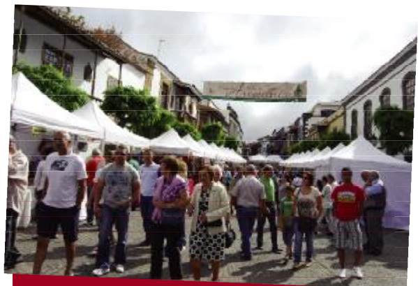
25-26 JULIO / La Feria de Artesanía estará en la Calle Real

XVI Feria de Artesanía Villa de Teror Calle Real y Plaza del Pino Domingo de 09:00 a 15:00 h.