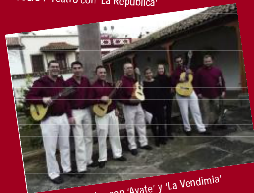
10 JULIO / Música con 'Ayate' y 'La Vendimia'