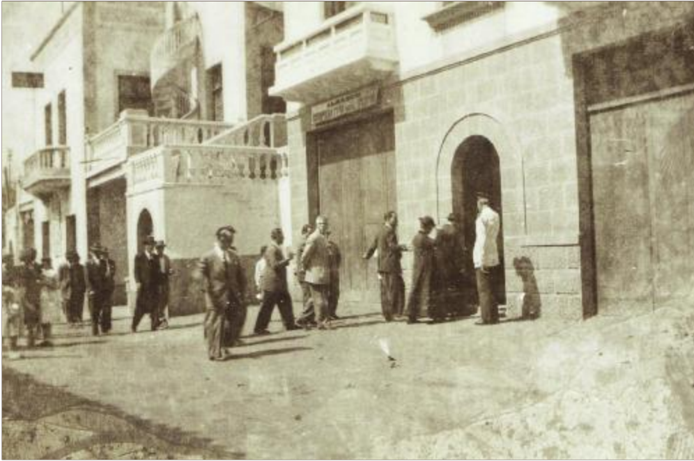
La Hermandad de Labradores de Teror se ubicó en su primera época en el Paseo González Díaz, junto al antiguo cine.