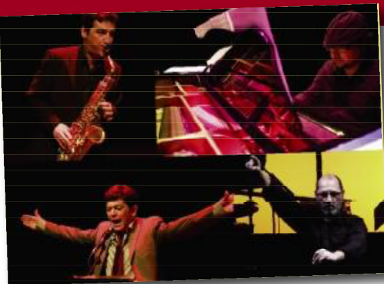
24 JULIO / La magia y el arte del buen flamenco

En el repertorio de este espectáculo reviven los palos flamencos donde las raíces más se adentran, Tonás, Seguiriyas, Soleá, Malagueñas, Bulerías...al golpe como gusta en nuestra tierra, y por supuesto tango flamenco para abrazarse al Revolucionario Astor Piazzolla en Libertango, Escualo, Balada para un loco..., alinearse con el compromiso social y del amor de autores como Benedetti, Borges o musical como compositores de la talla de J. Cage, I. Stravinsky y Kurt Weill.