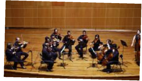
23 JULIO / Orquesta Camerata de GG y solistas de saxofón.

Polideportivo municipal. Comienza a las 20:00 h. Inscrip. 928630075 ext.01804 / 661117504 Epuipo: 100 € + 20 € fianza